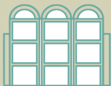
מרכז תרבות דתי לנוער נוה שאנן (ע"ד)